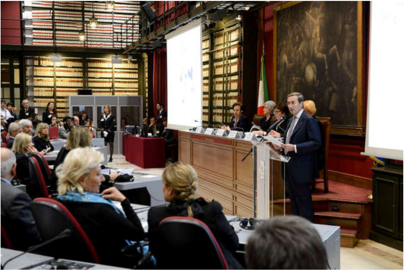
Il Presidente della Camera dei deputati, Gianfranco Fini, interviene alla Presentazione del volume "Il Premio Internazionale Alexander Langer alla Camera dei deputati 1997-2012"